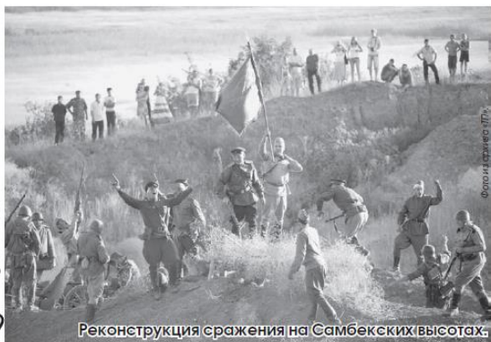
Реконструкция сражения на Самбекских высотах